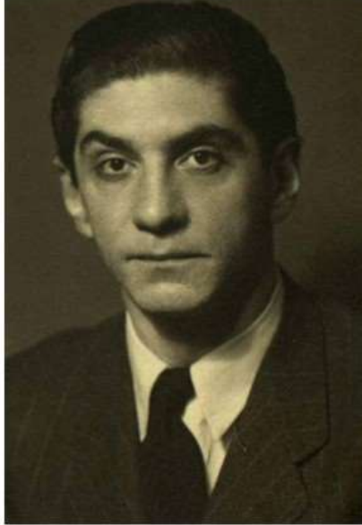
Abidin Dino gençliğinde.

(7 Aralık 2022'de ayorum.com'da yayınlandı.)