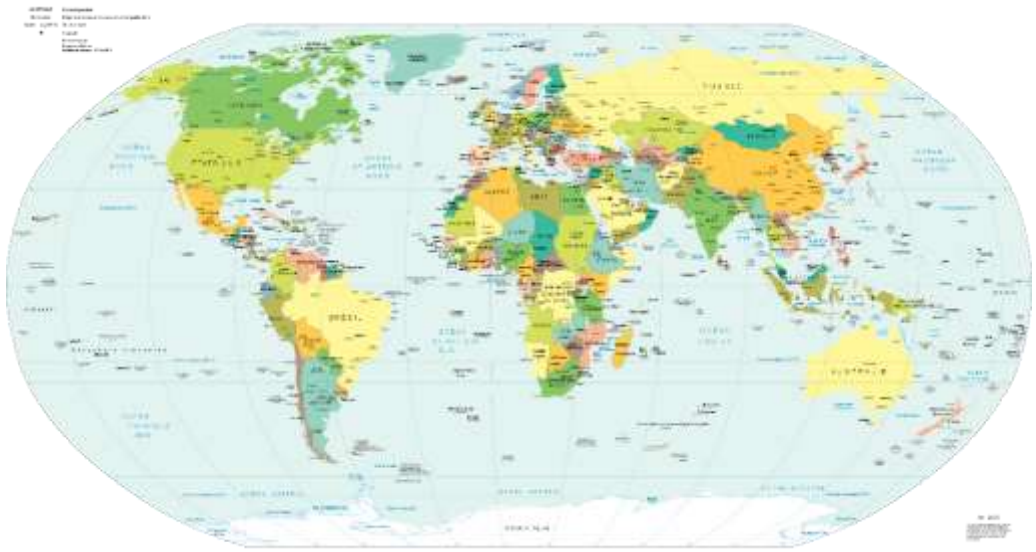
Carte politique du monde, avril 2005