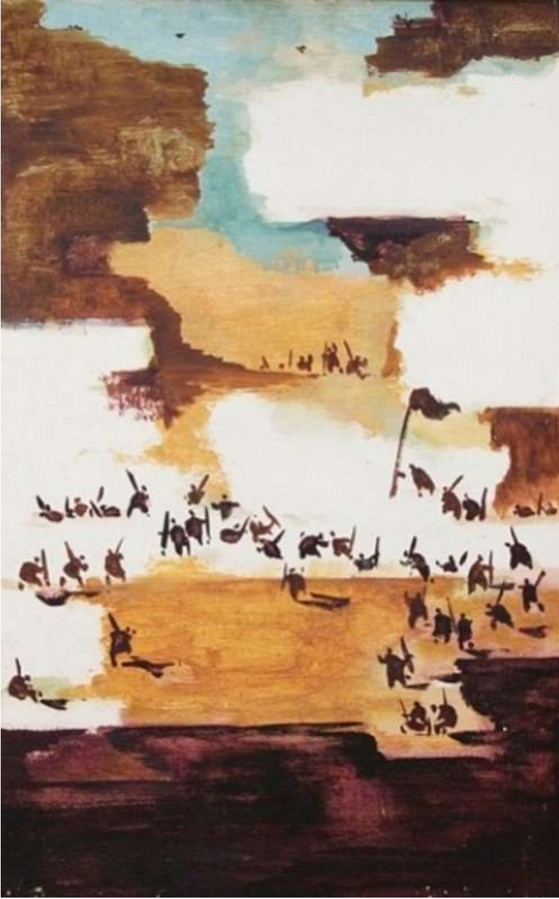
ABİDİN'DEN "UZUN YÜRÜYÜŞ".