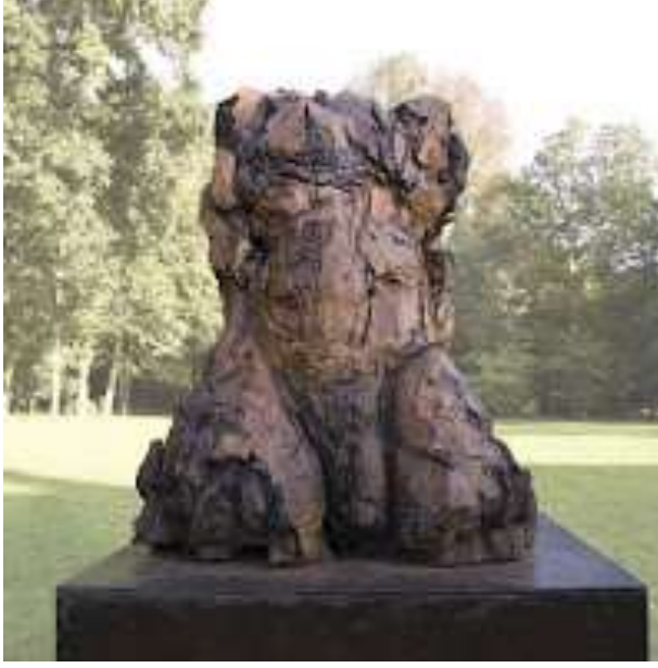
COŞKUN'UN İŞLERİNDEN BİRİ : "TORSE"

Yapıt görkemli. Güçlü. Başı, kolları ve elleri, bacakları ve ayakları olmayan bir "Gövde". "Aleti"yle. Peki bu eserde bu kadar çarpıcı olan nedir? İnsanoğlu binbir biçime girdi çıktı, girdi çıktı ve böylece kalakaldı mı ? Böyle de olabilir mi ?